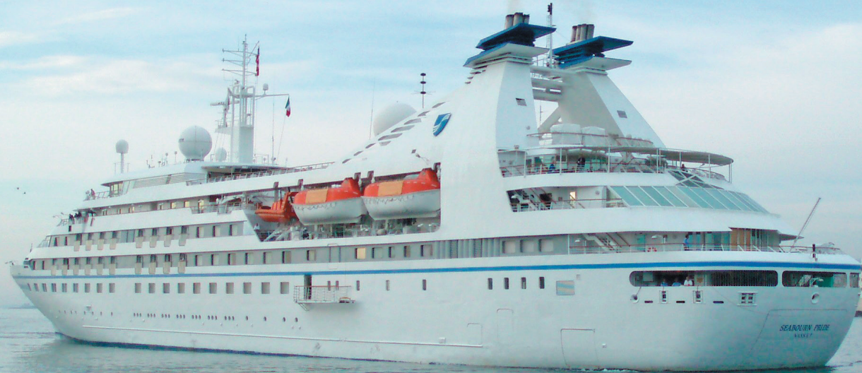
PORTO DI MONOPOLI