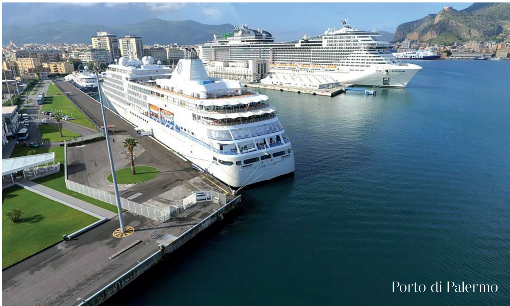
Porto di Palermo

Abbiamo pianificato, progettato, investito, realizzato e aperto