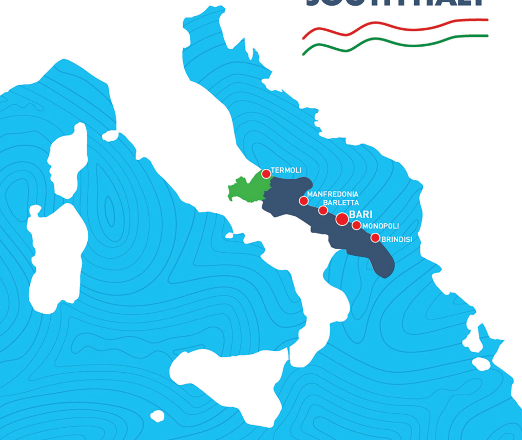
PORTO DI BRINDISI